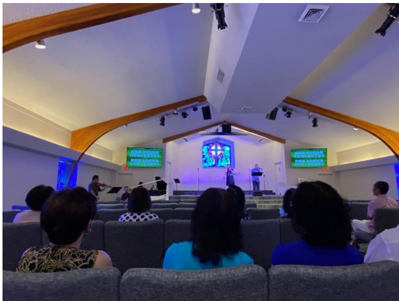
(FCBC Re-Opening Service June 6 th , 2021)